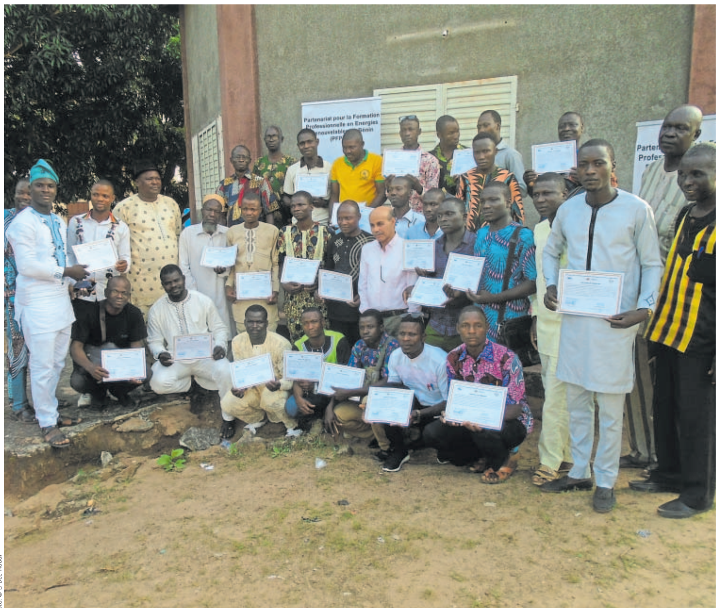
Die beniner Handwerker, die erfolgreich die Fortbildungsveranstaltungen zu den Themen Erneuerbare Energien / Photovoltaik abgeschlossen haben, erhalten ein Zertifikat, das als Qualitätssiegel für fachlich gute Dienstleistungen eingesetzt werden kann.